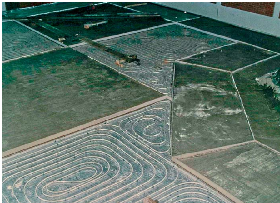
Ilustracija 5 Zalijevanje dilatacijskih polja cementnim estrihom

S obzirom na to da tehnološki napredak iz dana u dan donosi nove, strožije tehničko-tehnološke, ekonomske i, posebno, ekološke norme, valja se nadati da će se uz svekoliku stručnu javnost i država pobrinuti da poreznim olakšicama pri gradnji ekološki prihvatljivijih sustava doprinese značajnijem povećanju broja takvih instalacija kao što je to uobičajeno u razvijenim zemljama.