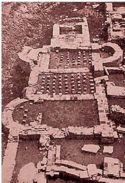
Ilustracija 1 Male rimske terme u Sirmiju (4. st. pr.Kr)