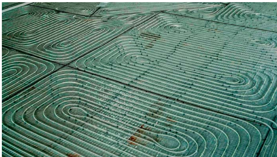
Ilustracija 4 Raspored dilatacijskih polja s položenim cijevnim registrima