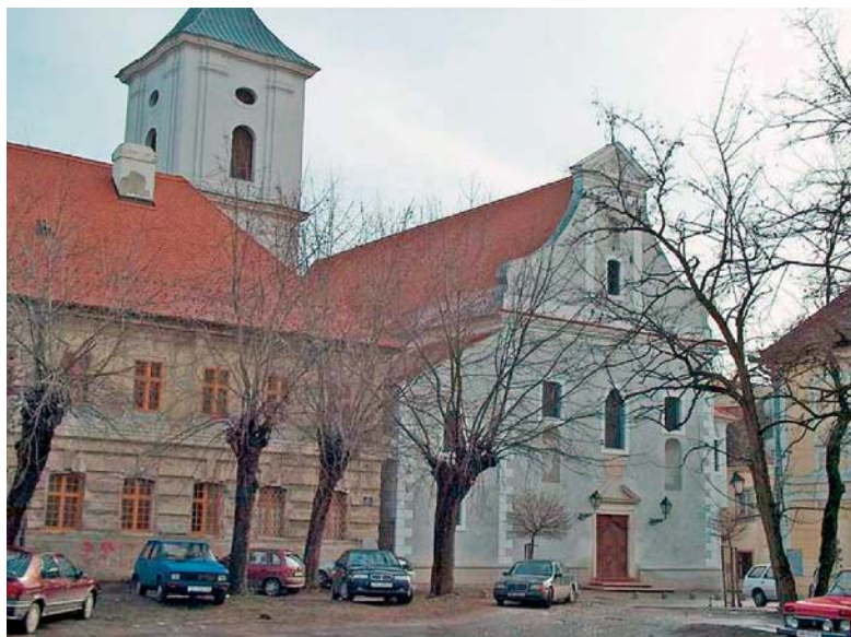
Ilustracija 2 Obnovljena Crkva uzvišenja sv. Križa u Osijeku