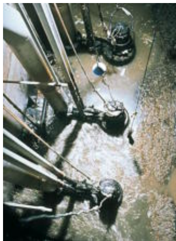
Ilustracija 1 Potopljene crpke u pogonu

Ipak, mogla bi se razmotriti instalacija serijskog (kaskadnog) spoja dvije crpke karakteristika Q = 25 \text{ l/s} , H = 3,0 \text{ bar} , P = 15 \text{ kW} , \eta_u = 0,55 . Pri tome odmah upada u oči da bi se serijskim spojem crpki s 2 \times 15 \text{ kW} instalirane snage