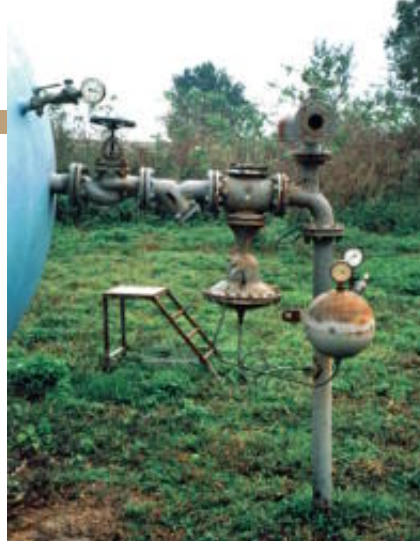
Ilustracija 4 Mjerno-regulacijska linija stlačenog zraka 15/4 bar

na cijenu investicije i troškove jednogodišnje eksploatacije sustava prikazani su u tablici 1. Pri analizi se ne smije ispustiti iz vida da je tlačni cjevovod dosta specifičan u odnosu na uobičajene slučajeve. To se prije svega odnosi na činjenicu njegove duljine (oko 5400 m) i nužnost priključenja lateralnog tlačnog cjevovoda na oko polovici duljine. Kao što je već rečeno, klasične kanalizacijske crpke s impelerom imaju veliko hidrauličko ograničenje, a to je zahtjev da tzv. slobodni prolaz kugle kroz crpku mora iznositi minimalno 80 - 100 mm zbog opasnosti od začepljivanja. Taj zahtjev posebno 'pogađa' sustave s malim protocima, do oko 50 l/s, u slučajevima dugačkih tlačnih cjevovoda.